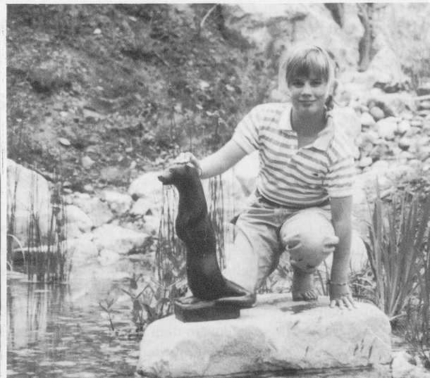
In der Höhlung des Summsteins kannst du deinen persönlichen Ton treffen; ein Fischotter aus Bronze ist Mahnmal für die bedrohte Natur.

eingemeisselt wurden, bilden ein einladendes Tor zum Erfahrungsfeld. «Dennoch – heute» heisst das über dem Torbogen stehende Motto, das zugleich der Titel eines Buches von Hugo Kuekelhaus ist und für die Kinder im Friedberg Da-Seins-Leitmotiv sein soll. Man übt mit ihnen, hier, im «Tor zum Leben», die Realität klar zu erkennen und nach der Standortbestimmung den Entschluss zu fassen, dennoch, allen Widerwärtigkeiten zum Trotz, heute es immer wieder neu zu wagen, miteinander unterwegs zu sein, einander zu helfen und beizustehen , und so zu einer positiven Entwicklung des eigenen Ich beizutragen. Im Zentrum der