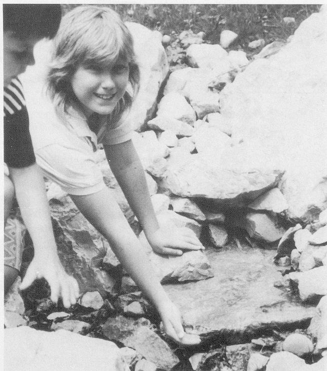
Auch die Quelle ist ein Ursymbol: Lass das Wasser durch deine Hände gleiten . . .