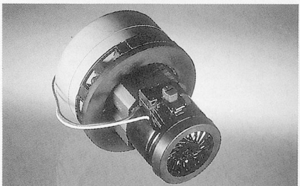
Verhindert Lärm: Das patentierte Akustiksystem.