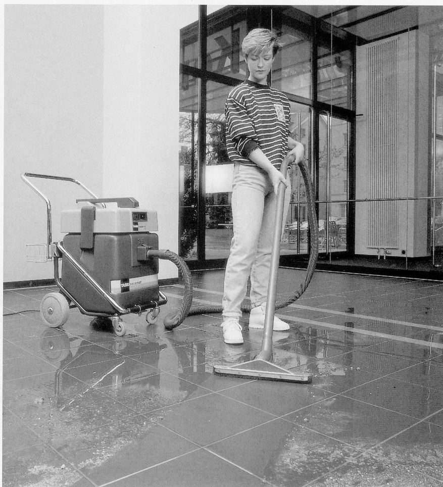
Dank dem Kombifilter kann ohne Umstellen nass und trocken gesaugt werden.

Wenn er richtig loslegt, bleibt kein Stäubchen und kein Tröpfchen ungesaugt. Dabei macht sein 2-stufiges Gebläse mit zwei Drehzahlbereichen trotz maximaler Leistung minimalen Lärm: Nämlich höchstens 64 dB. Ganz egal, ob er gerade Staub oder Wasser saugt. Das kann er beides - und zwar dank hocheffizientem Kombifilter ohne Umstellen. Zum Abscheiden von Feinstaub in kritischen Zonen steht ein Feinfilter zur Verfügung. Eine saubere Sache. Genauso wie die elektronische Niveauekontrolle, die automatisch den Motor ausschaltet, sobald der zähelastische, schlagfeste Kunststoff-Behälter voll ist. Dann kann dieser bequem entleert werden. Gleich drei verschiedene Varianten stehen dabei zur Wahl: Entleerschlauch, Kippgestell oder Bodenauslauf. Die anschließende Reinigung geht ohne Probleme, da das Material gegen die gebräuchlichen Putzmittel resistent ist. Und weil der Preis ebenso stark ist wie seine Leistung, sollten Sie ihn sich von Ihrem Lever Sutter-Berater einmal zeigen lassen. Am besten gleich in allen drei Ausführungen.