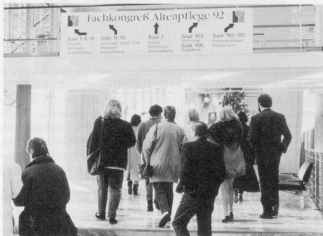
Der Fachkongress in Hannover bestand aus 63 Einzelveranstaltungen. Es kamen fast 4000 ZuhörerInnen.

Mit der Diskussion um den Pflegenotstand, der vorwiegend ein Personalnotstand ist, wird deshalb vor allem auch die Frage nach