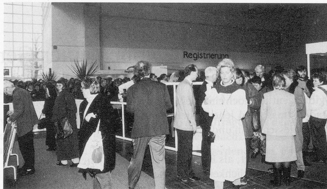
Der Andrang war gross. Insgesamt kamen über 21 000 Besucher nach Hannover.

Beschäftigte in der Altenpflege beklagen allgemein, keine Zeit für das Wesentliche zu haben. Was das Wesentliche ist, wird dabei vor allem intuitiv erfasst, was dazu führt, dass die Pflegenden es im praktischen Alltag wieder vernachlässigen. Hier ist eine gezielte Pflegeforschung nötig, die es ermöglicht, das Wesentliche der Pflege aus den Bedürfnissen von Patienten abzuleiten und schliesslich zu verallgemeinern.