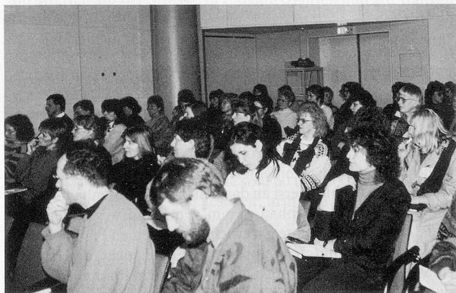
Die Kongressveranstaltungen waren schon Wochen vorher völlig ausgebucht.

Es sieht auch so aus, meint Käppeli, als ob das Bildungswesen im Beruf einen Wettlauf eingegangen wäre mit dem Zerfall der Pflegekultur. Je mehr sich die Arbeitsbedingungen verschlechtern, um so intensiver wird die berufliche Bildung und um so grösser wird das Fortbildungsangebot. «Pflegende absolvieren höhere Fachausbildungen, um nach deren Abschluss zu realisieren, dass sie nicht gefragt sind, dass es keine Arbeitsstellen für sie gibt, dass sie den Routinebetrieb stören und die Budgets der Pflegedienste unnötig belasten.»