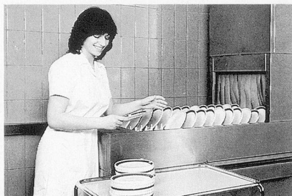
Glänzendes Ergebnis beim Geschirr: Sumazon und Sumabrite.