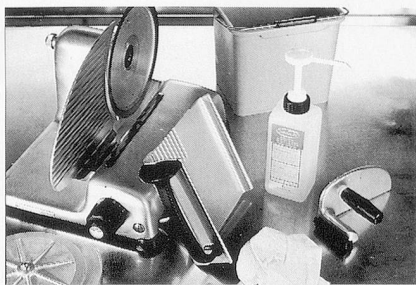
Sumanet, Sumabac, Sumarein: Alles für hygienisch-saubere Küchenmaschinen.