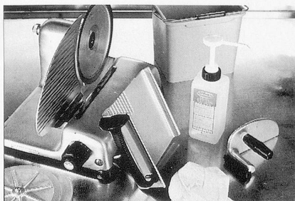
Sumanet, Sumabac, Sumarein: Alles für hygienisch-saubere Küchenmaschinen.