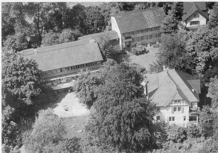
Das Kinderspitäli; hinten die beiden Heim-Trakte, im Vordergrund das Personalhaus mit Schule und Physiotherapie im Erdgeschoss.