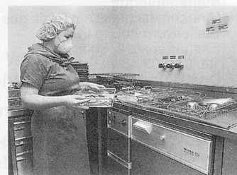
Miele Thermodesinfektor in der Chirurgie.

W er einmal auf einer Intensivstation war, weiss wie aufwendig die Pflege von Intensivpatienten ist. Denn nach einer Operation ist der Patient oft nicht gleich wieder auf den Beinen. Zur aufopfernden Pflege gehört im Spital eine umfassende Infrastruktur, ohne die die Arbeit der Ärzte und Pfleger nicht möglich wäre: sauber sterilisierte Operationsbestecke, desinfizierte Beatmungsgeräte, Tubusse usw.