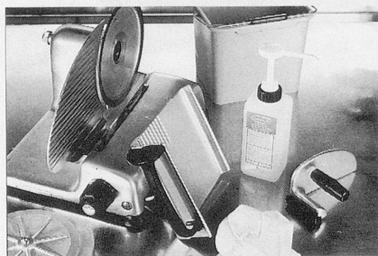
Sumanet, Sumabac, Sumarein: Alles für hygienisch-saubere Küchenmaschinen.