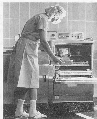
Miele Thermo-Desinfektor in der Chirurgischen Klinik des Universitätskinderhospitals Zürich

D ie Chirurgische Klinik des Universitätskinderhospitals Zürich verfügt über das einzige schweizerische Zentrum zur Behandlung brandverletzter Kinder. Jährlich werden hier etwa 100 Kinder mit schweren Verbrühungen und Verbrennungen behandelt.