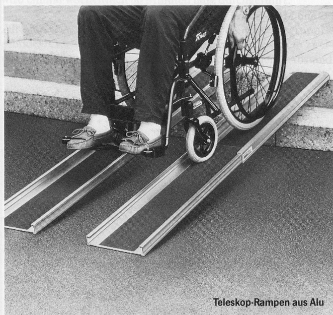
Teleskop-Rampen aus Alu