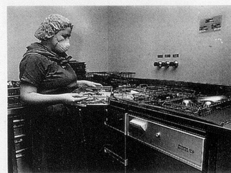
Miele Thermodesinfektor in der Chirurgie.

W er einmal auf einer Intensivstation war, weiss wie aufwendig die Pflege von Intensivpatienten ist. Denn nach einer Operation ist der Patient oft nicht gleich wieder auf den Beinen. Zur aufopfernden Pflege gehört im Spital eine umfassende Infrastruktur, ohne die die Arbeit der Ärzte und Pfleger nicht möglich wäre: sauber sterilisierte Operationsbestecke, desinfizierte Beatmungsgeräte, Tubusse usw.