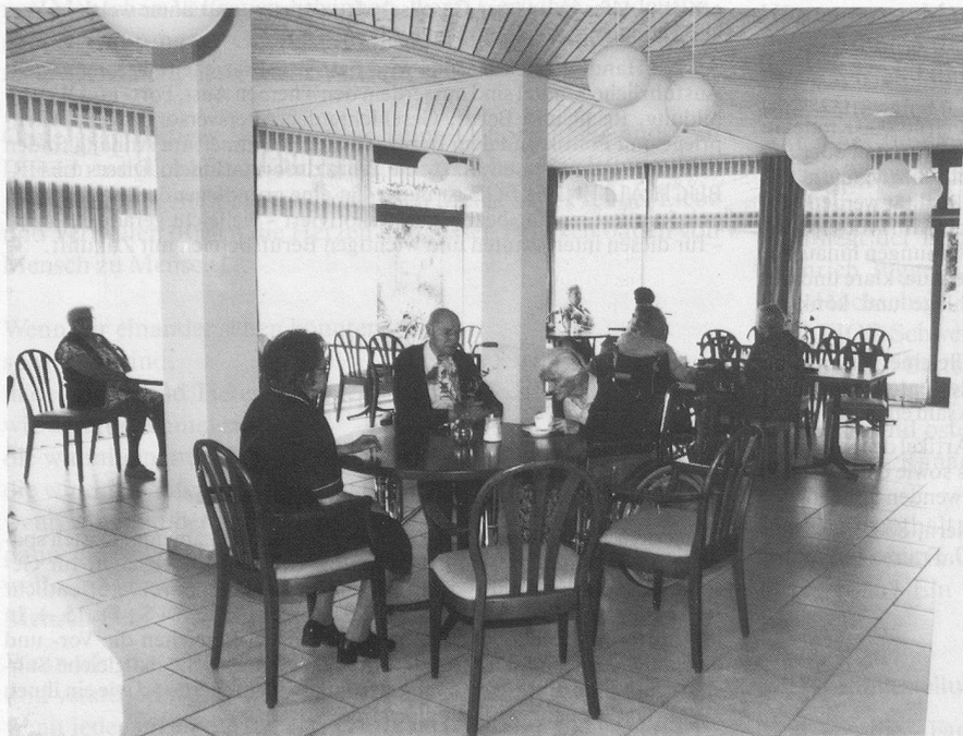
Umbauten: Das Rapperswiler Länzerthus hat nun mehr Wohnqualität zu bieten. Unser Bild zeigt die neue Cafeteria.

Im abgelaufenen Berichtsjahr 1989 sowie im ersten Quartal 1990 wurden im Rapperswiler Alters- und Leichtpflegeheim Länzerthus für rund eine Million Franken Umbau- und Anpassungsarbeiten getätigt. So entstanden im ersten Obergeschoss, in der Leichtpflegeabteilung, ein Speisesaal sowie ein neuer Dienstraum. Das Erdgeschoss wurde um den bisherigen gedeckten Sitzplatz erweitert und erhielt so eine ansprechende Cafeteria, neue Bodenbeläge lassen die Räume heller und freundlicher erscheinen.