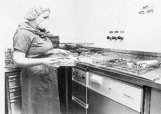
Miele Thermodesinfektor in der Chirurgie.

W er einmal auf einer Intensivstation war, weiss wie aufwendig die Pflege von Intensivpatienten ist. Denn nach einer Operation ist der Patient oft nicht gleich wieder auf den Beinen. Zur aufopfernden Pflege gehört im Spital eine umfassende Infrastruktur, ohne die die Arbeit der Ärzte und Pfleger nicht möglich wäre: sauber sterilisierte Operationsbestecke, desinfizierte Beatmungsgeräte, Tubusse usw.