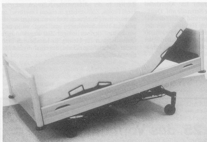
Beintiefelage, ideal bei herzleidenden Patienten mit arteriellen Durchblutungsstörungen in den Beinen

«HEIMELIG»-Pflegebetten sind nicht nur dank der äusserst günstigen Mietkonditionen in der ganzen Schweiz sehr beliebt. – Nein –, sie überzeugen auch in der einfachen und zuverlässigen Bedienung und den vielseitigen