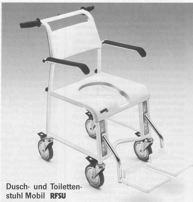
Dusch- und Toilettenstuhl Mobil RFSU

Haco AG, 3073 Gümligen, Tel. 031/52 00 61