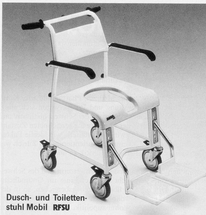
Dusch- und Toilettenstuhl Mobil RFSU

Nähere Auskünfte sind im Sekretariat der Stiftung (Dählenweg 34, 3028 Spiegel, Telefon 031 53 90 24) erhältlich.