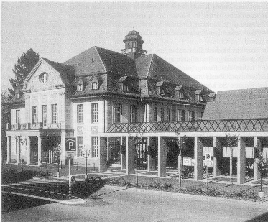
Das Zuger Casino: Ein gastlicher Tagungsort.