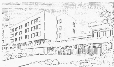
Regionales Pflegeheim 8762 Schwanden

In unserem neuzeitlich eingerichteten Pflegeheim betreuen wir 78 Patienten. Auf Januar 1989 möchte unsere langjährige Leiterin zurücktreten. Für die Nachfolge suchen wir eine/einen