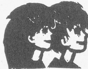
Beobachtungsstation Sonderschulheim Aussenwohngruppe

Alterswohnzentrum «Gässliacker», Mühleweg 2, 5415 Nussbaumen.