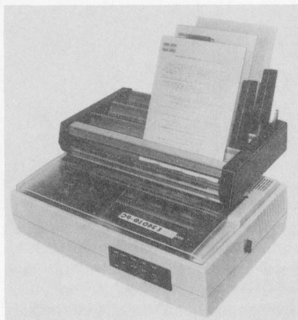
Der E340LQ-PC, Flaggschiff in der Matrix-Klasse, überzeugt durch Benutzerfreundlichkeit und etliche gute Ideen der Konstrukteure und des Marketings.

Dass zu einem Typenraddrucker auch verschiedene Typenräder gehören, ist vollkommen selbstverständlich. Weniger selbstverständlich ist jedoch, dass zu einem Matrixdrucker serienmässig eine Diskette gehört.