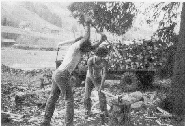
Obwohl diese Asylbewerber offiziell noch nicht arbeiten dürfen, gibt es doch immer wieder Gelegenheiten, das kärglich bemessene Sackgeld (Fr. 4.– pro Tag) etwas aufzubessern.

Diese intensive Betreuung hat in der Anfangsphase sicher seine Berechtigung, wenn die Asylbewerber oft völlig verstört, verängstigt und hungrig in unsere moderne Zivilisation katapultiert werden. Die Betreuung wird aber zur Überbetreuung bei Asylbewerbern, die schon drei bis vier Monate im Zentrum leben. Bei ihnen kommt es zu den wohlbekannten Hospitalismus-Symptomen: Sie weigern sich, Eigeninitiative zu entwickeln, Verantwortung zu übernehmen und ihr Leben selbst zu gestalten. Alles wickelt sich über die Betreuer ab, was ganz extreme