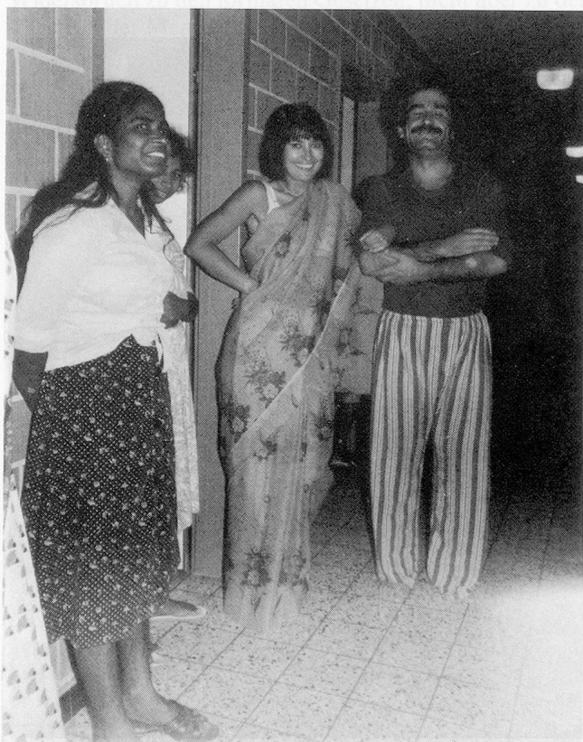
Nur die schöne Polin, eingekleidet von den beiden Tamielinnen, hat es geschafft, den berüchtigten türkischen Dauerschläfer aus den Federn zu holen. Er ist allerdings noch im Pyjama ...

Überwindet der Asylbewerber diese erste Hürde erfolgreich, dann beginnt das grosse Warten: Beim Eidgenössischen Polizei- und Justizdepartement sind momentan rund 26 000 Gesuche hängig. Deshalb kann es fünf Monate (wenn das Gesuch vorrangig behandelt wird), aber auch fünf Jahre dauern, bis der Asylbewerber das Aufgebot von Bern zur zweiten Befragung erhält. Diese zweite Befragung