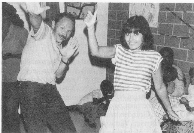
Ungewissheit, Langeweile und Frustration – aber auch unbändige Lebenslust, Heiterkeit und heisse Rhythmen gehören zum Alltag im Durchgangszentrum.

Formen annehmen kann: Wenn etwa ein gelernter Elektriker einen Betreuer bittet, das Licht an seinem Fahrrad zu reparieren! Lethargie, Unlust und Depressionen wachsen parallel dazu.