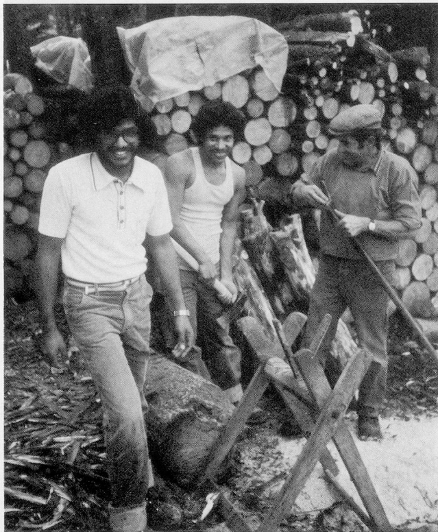
Dieser Bauer im Alptal (SZ) wird die Tamilen sicher in guter Erinnerung behalten: Gegen ein bescheidenes Entgelt haben sie ihm eine Woche lang geholfen.

– die sich auf das Protokoll der ersten Befragung stützt – entscheidet alles. Dieser Entscheid lässt aber oft auch sehr lange auf sich warten (manchmal jahrelang). Seit etwa einem Jahr werden die neuen Asylgesuche vorrangig behandelt, während die alten liegen bleiben. Positive Entscheide werden immer seltener, die goldenen 60er Jahre, insbesondere für Ostflüchtlinge, sind vorbei: Die Quote der positiven Asylentscheide nähert sich der 10-Prozent-Grenze. Dabei ist die Verteilung auf die verschiedenen Nationalitäten sehr unterschiedlich. An der Spitze stehen immer noch Flüchtlinge aus kommunistischen Ländern: Im letzten Jahr erhielten 32,5 Prozent der