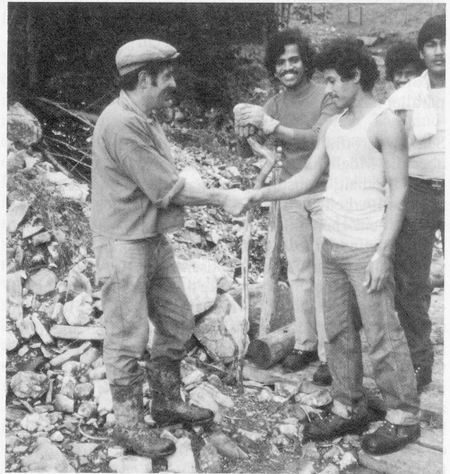
Der Dank nach getaner Arbeit: «Allein hätten wir es nie geschafft!»

Gegen den negativen Entscheid ist ein Rekurs möglich, die Erfolgsaussichten sind aber gering. Wenn man keine neuen Fakten und Belege beibringen kann, hat man kaum Chancen. Ist auch dieser Entscheid negativ, bleiben nur noch einige winzige Hintertürchen , um nicht ausgewiesen zu werden: Internierung oder Verzicht auf Ausweisung aus humanitären Gründen zum Beispiel. Ansonsten aber heisst es unbarmherzig: Verlassen Sie die Schweiz, oder Sie werden in Ihr Heimatland zurückgeschafft. Eine solche