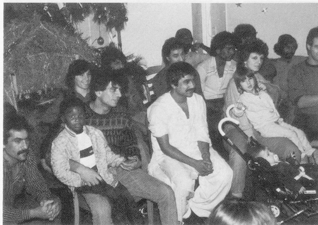
Ob schwarz, braun oder weiss, ob Hindu, Christ oder Mohammedaner: Weihnachten wird gemeinsam gefeiert!

Diese Begegnungen müssen allerdings meistens gut vorbereitet werden. Selbstverständlich ist es schön, wenn eine Schweizer Familie Asylbewerber einlädt. Was aber tun, wenn der Asylbewerber immer grössere Ansprüche entwickelt, zu jeder Tageszeit anruft, immer wieder unaufgefordert erscheint und sich schliesslich völlig bei seinen Gastgebern einquartiert? Was ist zu tun, wenn der Asylbewerber Geld verlangt, immer unverschämter auftritt und nicht mehr zwischen Mein und Dein unterscheidet? Solche Situationen können durch klare Richtlinien und Information vermieden werden. Dabei geht es nicht darum, die Beziehung Asylbewerber-Schweizer von Anfang an zu kanalisieren oder auf Sparflamme zu halten. Ein Schwei-