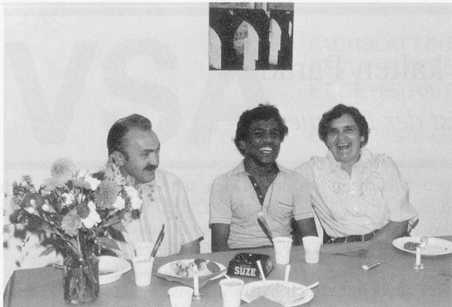
Tag der offenen Tür in Bettlach: Wenn das Eis erst einmal gebrochen ist, kommt man sich schnell näher...

Bewohner des Hauses unsere Lebensweise, unsere Kultur und die Gegebenheiten so weit begreifen soll, dass er später in der harten, «kalten» schweizerischen Realität bestehen kann. Er muss beispielsweise wissen, wie, wo und für wieviel Geld er einkaufen soll und wie er das Ganze dann zu einer schmackhaften Mahlzeit verwertet – auch wenn er zu Hause nie selbst gekocht hat, weil das «Frauensache» war. Auch etwas so Banales wie das Putzen kann zu einem grossen Problem – und zwar aus praktischen wie soziokulturellen Gründen – werden.