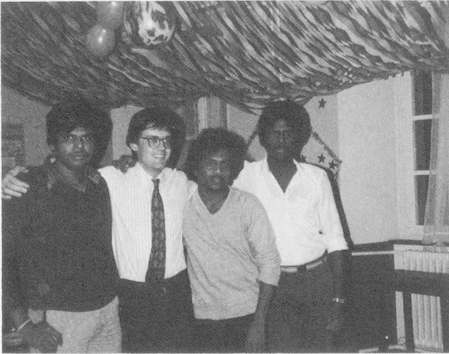
Der Berichtstatter (Zweiter von links) nimmt Abschied vom Durchgangszentrum: Hemd, Krawatte und Socken (nicht im Bild) sind die Geschenke der tamilischen Zentrumsbewohner.

Jungen nur schon gemeinsam ins Kino gehen. Alkohol ist für junge Männer tabu. Bis etwa 25 Jahre stehen sie unter der überaus strengen Aufsicht des Vaters.