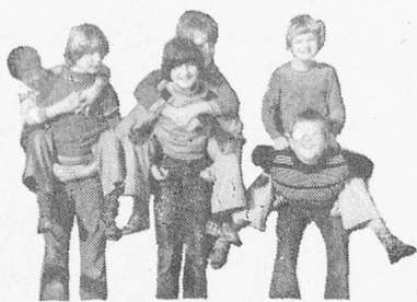
Schulheim Effingen Aargauer Jura