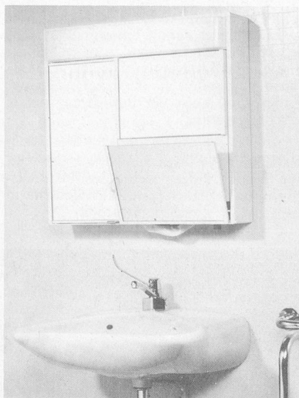
Spiegelschrank, Modell GLS/HP 75 D mit integriertem Kippspiegel KSP-2

W. Schneider + Co. AG, Metallwarenfabrik, CH-8135 Langnau-Zürich