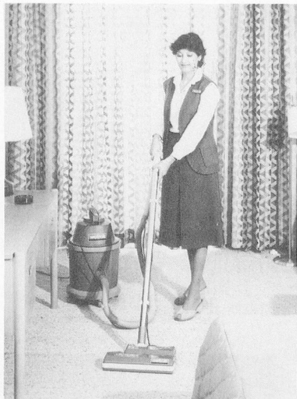
Wetrok-Bantam mit Wetrok-Picojet 300 bei der Reinigung eines Hotelzimmers.

Einen praktischen Gewerbestaubsauger mit grosser Leistung und kleinem Preis hat die Wetrok-Organisation Zürich (Maschinen, Geräte, Produkte und Methoden für die rationelle Gebäudereinigung) neu auf den Markt gebracht.