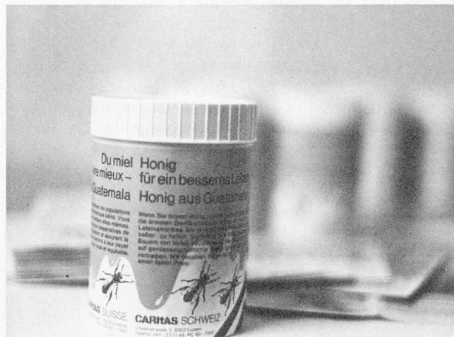
Honig für ein besseres Leben – Honig aus Guatemala.

CARITAS Schweiz übernimmt jedes Jahr ein grösseres Quantum der Honigproduktion aus dem Departement El Quiché im Nordwesten Guatemalas und aus der Gegend von Rancagua in Chile. Damit kann diesen Kleinbauern ein gewisses Einkommen gesichert werden.