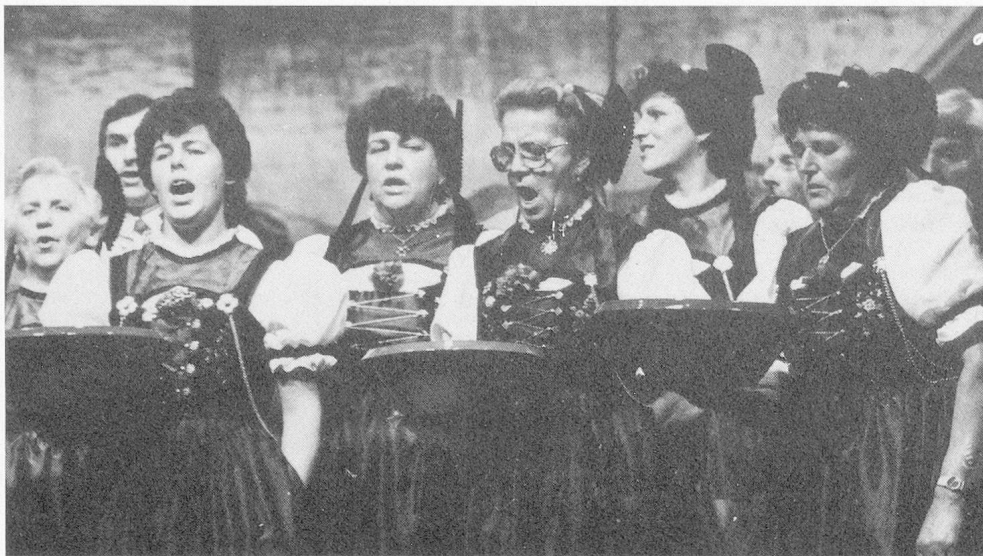
Die Trachtengruppe Ebnet-Kappel im «Thurpark»: Wer glaubt, das Talerschwingen sei ein Kinderspiel, soll's diesen singenden Frauen bitte nachmachen!