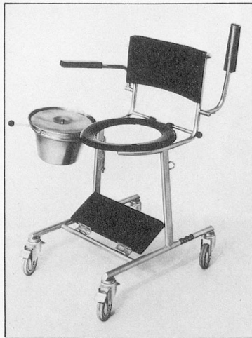
Klosettrollstuhl Mod. 49, Fussbrett, WC-Brille und Topfhälter wegnehmbar. Kann über Klosomat gefahren werden.