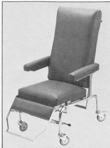
Patientenfauteuil A/0176 S, Armlehnen aufklappbar, Verstellautomatik, Kunstlederbezug, verchromt mit 100 mm Lenkrollen, Fussraster fünfmal verstellbar.