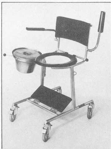
Klosettrollstuhl Mod. 49, Fussbrett, WC-Brille und Topfhalter wegnnehmbar. Kann über Klosomat gefahren werden.