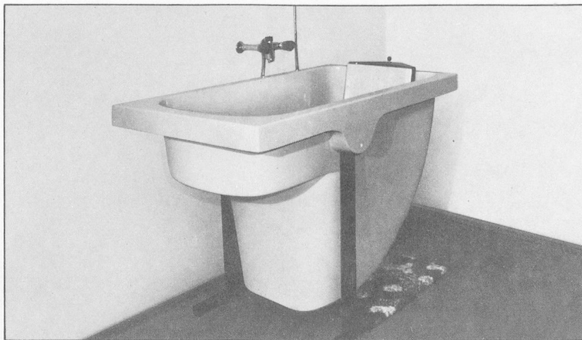
BILL-Wanne, aus glasfaserverstärktem Polyesterharz, für einfaches und problemloses Baden von Behinderten und Betagten.