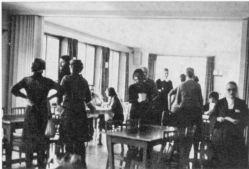
Nach strenger Arbeit ist eine Kaffeepause hochwillkommen