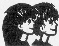
Luzerner Jugendheim Schachen

Verwaltung Alterswohnheim Bühli, 8755 Ennenda/Glarus, Tel. 058 61 15 22.