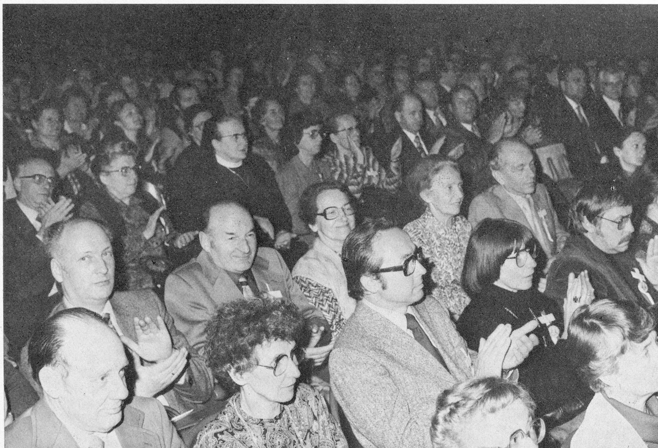
Casino Winterthur: Zwischen 350 und 400 Zuhörer im Saal des alten Stadttheaters folgen den Vorträgen zum Thema «Das Alter — Verlust und Gewinn» mit grosser Aufmerksamkeit.

Ungeachtet dessen ist es freilich Tatsache, dass heute immer noch oder immer mehr jenes Menschenbild Gültigkeit hat, das vor 2500 Jahren etwa in den Plastiken des Praxiteles Form und Gestalt gewann, Stichwort: «Mens sana in corpore sano!» Der verstorbene Berner Kulturphilosoph Jean Gebser hat die Zeit des von den Griechen begründeten Menschenbildes die Vorherrschaft des mentalen Bewusst-