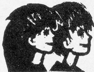
Luzerner Jugendheim 6105 Schachen