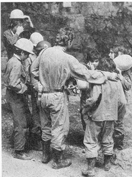
Einsatzbesprechung vor dem Einstieg. Bei einer derart anspruchsvollen Höhlentour kann das Unfallrisiko nur durch absolute Disziplin eingeschränkt werden.

Auf der Suche nach einem Filmstoff, der es gestatten würde, die Friedeck sowohl anno 1826 (als sie als «Rettungsherberge für verarmte Kinder» gegründet worden war) als auch in ihrer heutigen, veränderten Situation einzubeziehen, stiess man auf die sagenumwobene Falkensteiner Höhle bei Urach/BRD, über die es in einem Fachbuch unter anderem heisst: «Die längste ... unausgebaute Höhle der Schwäbischen Alb ist die Falkensteiner Höhle (... Länge 2846 m, gefährlich) ... Von 1770 an wurde einige Jahrzehnte hindurch in dem damals schon bekannten Höhlenteil erfolglos (nach Gold) geschürft ... Aus-