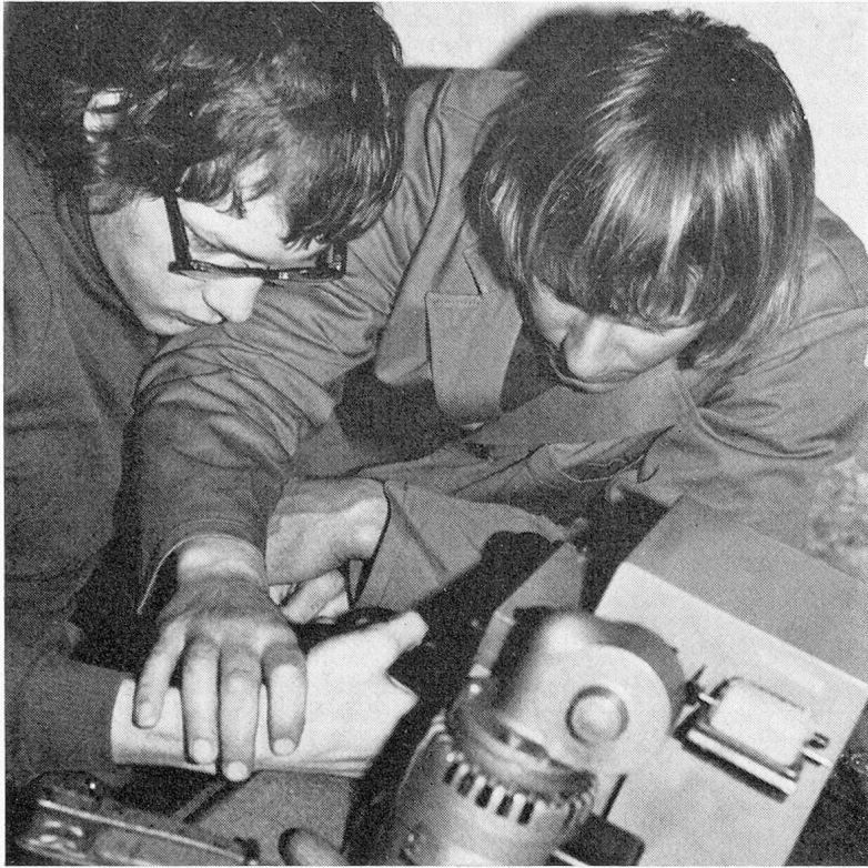
Verständnisvoll wird die Hand geführt.

echte Möglichkeit erwiesen und werden in vielen Fällen verhindern, dass Schwerbehinderte, die keine wirtschaftlich verwertbaren Leistungen zu erbringen vermögen, schon als Jugendliche in Alters- und Pflegeheime eingewiesen werden müssen.