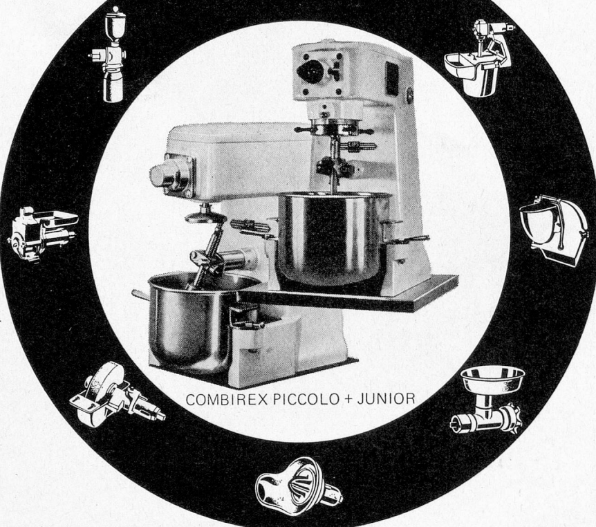
COMBIREX PICCOLO + JUNIOR