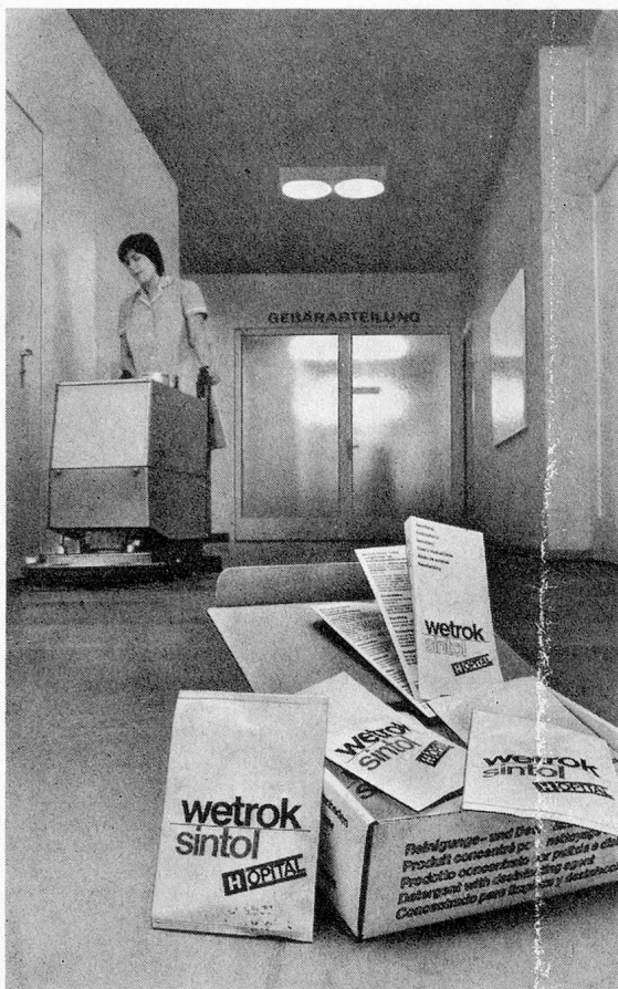
Sintol Opital wird in Beuteln zu 70 ml geliefert, die in 10 Liter Wasser aufgelöst werden. So problemlos ist die Dosierung!

Jetzt ist es möglich, ohne zusätzlichen Arbeitsgang zu reinigen und nachweisbar hochwirksam zu desinfizieren.