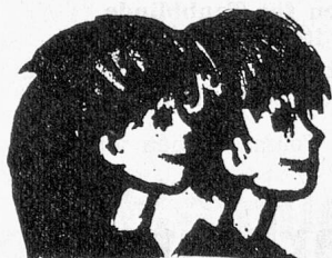
Stadtluzerner Jugendheim Schachen

Verwaltung Alters- und Pflegeheim Dettenbühl, Wiedlisbach, Tel. 065 6 26 21. I/687-NW