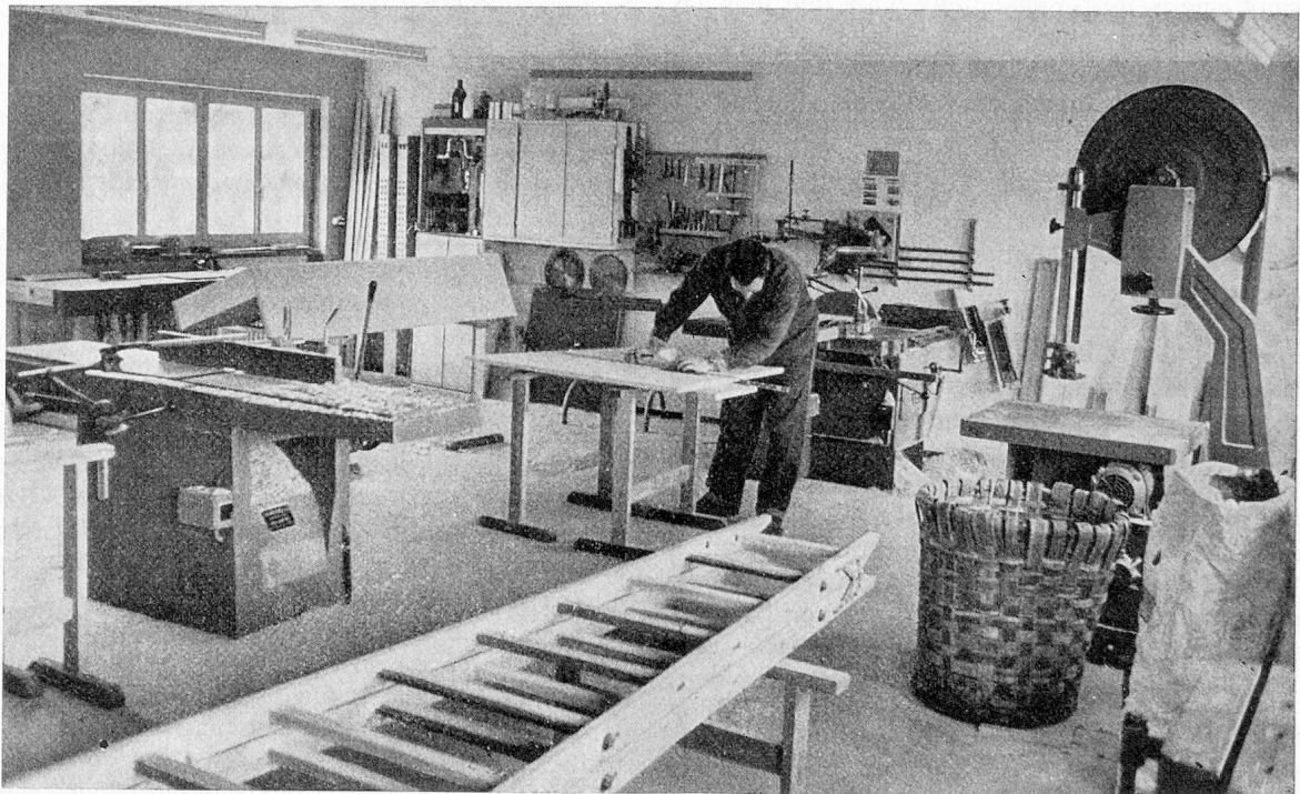
In der Schreinerwerkstatt

Der Landwirtschaftsbetrieb mit den vielen Tieren ist auch für die Kinder der Patienten ein interessantes und überaus beliebtes Tummelfeld und erleichtert die persönlichen Beziehungen zur Familie ungemein. Die Kinder kommen immer gerne nach Ellikon. Die Atmosphäre im Heim ist frei und gelöst, das Heim stets offen, und alle Patienten schätzen das Leben in der Geborgenheit einer Grossfamilie.