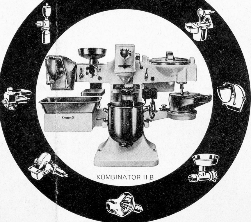
KOMBINATOR II B