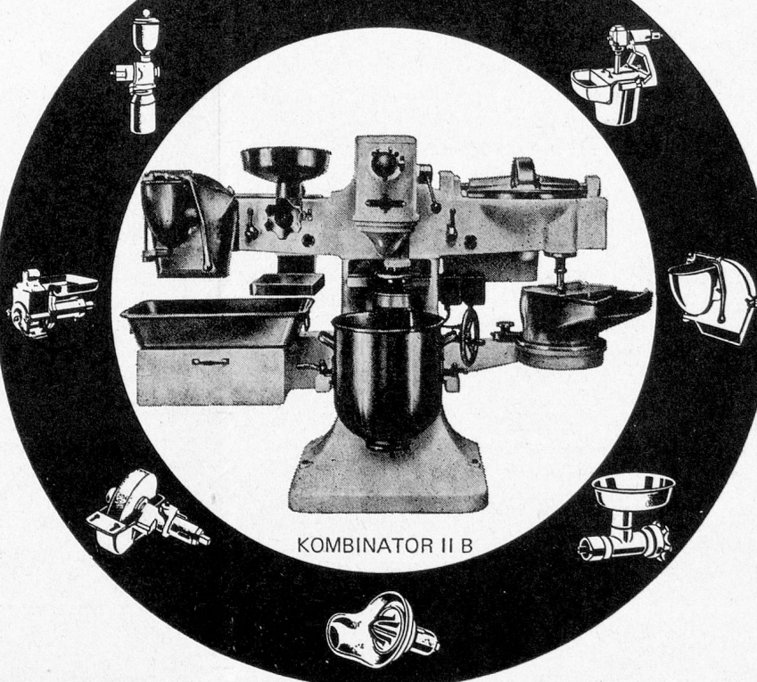
KOMBINATOR II B