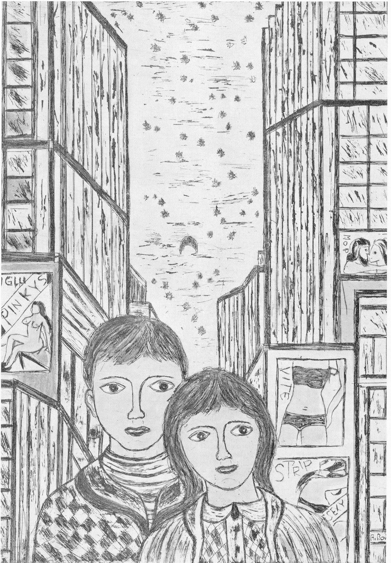
Die Aussenseiter in der Großstadt, Radierung von Annemarie Bommer, Schaffhausen.