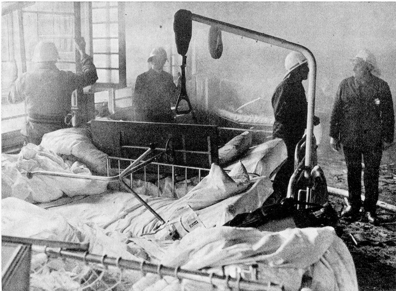
Einer der Schlafräume im Alterstrakt des «Burghölzli», wo im März 1971 ein Brand ausbrach, dem 28 Insassen zum Opfer fielen

Hilfsgeister unermüdlich. Anschläge am schwarzen Brett oder Merkblätter wären auch für diese Menschen nicht sehr zweckmässig.