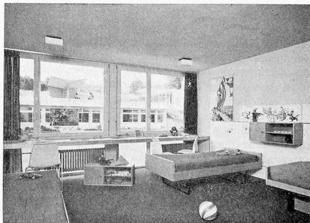
Dreier-Schlafzimmer in Gruppenwohnung. Fensterbrüstung Rohglas, mit breiter Simse als Tisch (keine dunkeln Bodenpartien), Kästchen zum Aufhängen und zum Stellen.

Die Realisierung eines Projektes wie das des Schulheimes für cerebral Gelähmte ist in mancher Hinsicht beispielhaft. Hier wurde ersichtlich,