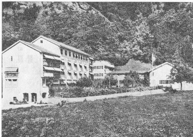
Kinderheim Giuvaulta, Rothenbrunnen

Das Bestreben des Bundesamtes für Sozialversicherung, die Eingliederungsstätten im grösseren regionalen Rahmen einigermaßen zu planen und zu realisieren, ist verständlich und in einem Bergkanton mit seinen kon-