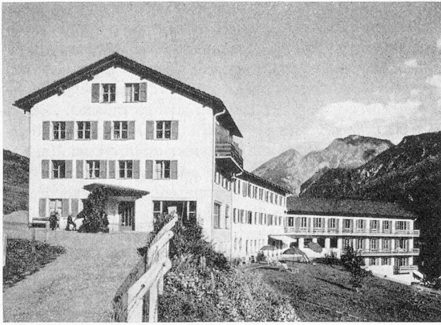
Chasa Puntota Scuol — Altersheim im Engadin