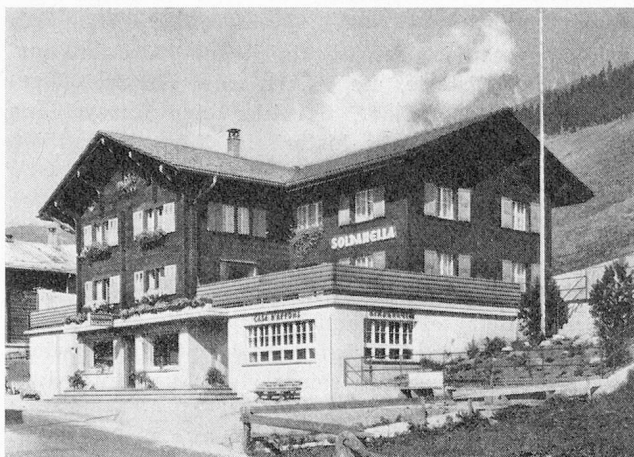
Landhaus Soldanella, Rueras

stanten Finanzsorgen eine Notwendigkeit. Wie andersorts auch, sind in Graubünden vorerst bestehende Heime zu Sonderschulheimen umstrukturiert worden, um so den Anforderungen beim Anlaufen der Invalidenversicherung einigermaßen gerecht zu werden. Die später anlaufende Heimplanung musste in die gesamte Sonderschulplanung miteinbezogen werden. Dabei können nicht schweizerische Modelle übernommen werden. Es gibt hier nicht einfach wieder den ominösen «Sonderfall Graubünden». Aber es gibt den Sonderfall «Berggebiet» mit der ausserordentlich niedrigen Bevölkerungsdichte, es gibt das Problem der Bevölkerungsabwanderung mit selektivem Charakter für die Zurückbleibenden. Es gibt vermutlich eine höhere Quote an endogenem Schwachsinn, die Altersstruktur der Bevölkerung entspricht nicht dem schweizerischen Durchschnitt. Dazu kommt, als echtes bündnerisches Sonderproblem, das Sprachenproblem mit den verschiedenen romanischen Idiomen nebst der deutschen und italienischen Sprache und das ausgeprägte konfessionelle Denken, das bei der Heimplanung auch zu beachten ist.