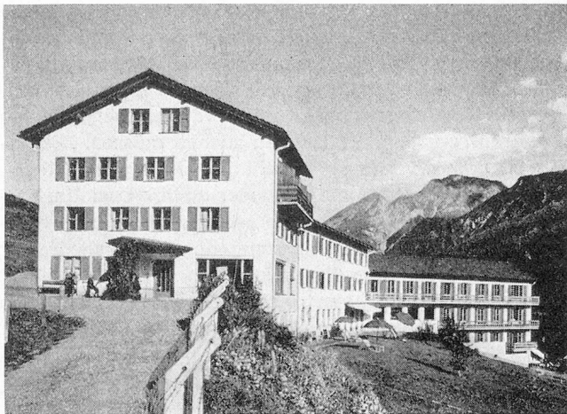
Chasa Puntota Scuol — Altersheim im Engadin