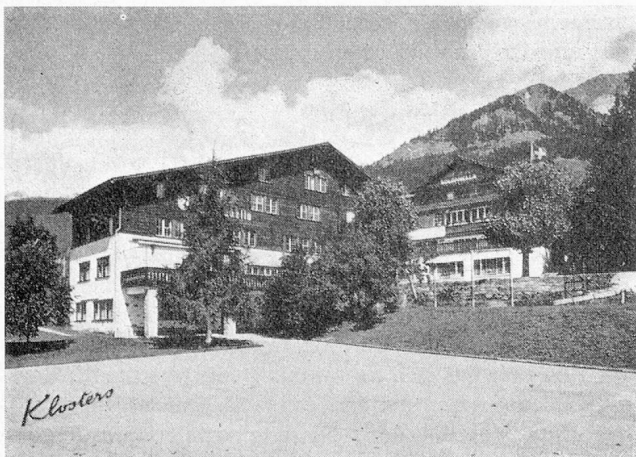
Kinder- und Ferienheim Soldanella, Klosters