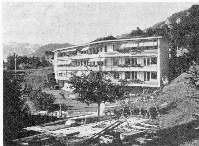
Kinderpflegeheim Scalottas, Scharans

Wir sind uns in Graubünden bewusst, dass im Aufbau der Kinderheime wie auch der Heime für die Betagten und Pflegebedürftigen noch Lücken bestehen. Schön ist jedoch, dass wir mit unserem Bergkanton doch in der Lage sind, die Uebersicht über diese Notwendigkeiten zu behalten, dass wir im grossen und ganzen eigentlich nicht stark hinter den finanzstarken Kantonen nachhinken, dass wir in der Qualität der Institutionen und ihrer Wirksamkeit aber danach streben, nicht im hinteren Glied zu stehen.