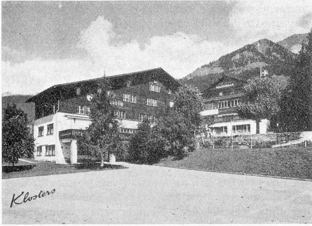
Kinder- und Ferienheim Soldanella, Klosters