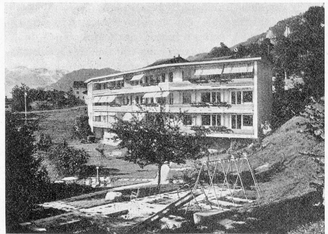
Kinderpflegeheim Scalottas, Scharans

Wir sind uns in Graubünden bewusst, dass im Aufbau der Kinderheime wie auch der Heime für die Betagten und Pflegebedürftigen noch Lücken bestehen. Schön ist jedoch, dass wir mit unserem Bergkanton doch in der Lage sind, die Uebersicht über diese Notwendigkeiten zu behalten, dass wir im grossen und ganzen eigentlich nicht stark hinter den finanzstarken Kantonen nachhinken, dass wir in der Qualität der Institutionen und ihrer Wirksamkeit aber danach streben, nicht im hinteren Glied zu stehen.