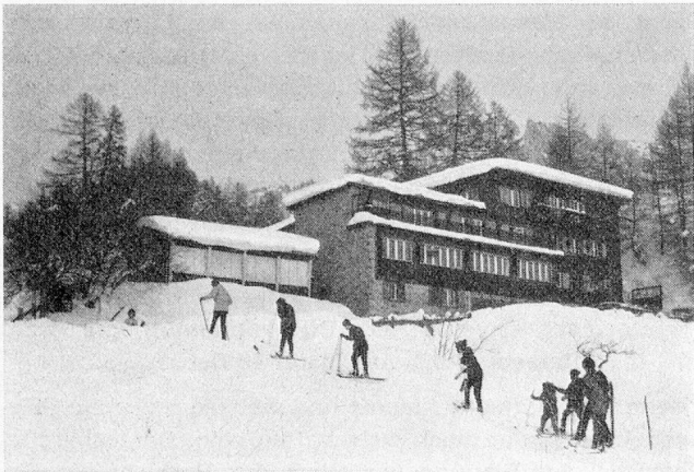
Kinderheim Feldis im Winter

der hilflos im Bett liegt, als Pflegefall zu akzeptieren, denn einen 50jährigen Idioten, der unsauber ist. Wenn wir erst einen gleichaltrigen, unintelligenten, charakterlich schwerst Auffälligen vor uns haben, einen Mann, der queruliert oder haltlos ist, so denkt man eher an die «Korrektionsanstalt» denn an das Pflegeheim für psychisch Auffällige. Was bei Akutspitälern und geriatrischen Kliniken sich in der Aufgabenteilung schon längst eingespielt hat, wird auch zwischen psychiatrischen Spitälern und ihren Pflegeheimen zwingend kommen müssen. Das psychiatrische Spital wird vermehrt zum Akutspital und braucht dazu zwingend sein spezifisches Pflegeheim. Dass es sich dabei nicht einfach um Abstellstationen handeln darf, sondern um Heime, die menschenwürdig sind, in denen die nötige Therapie und Betreuung gewährleistet ist, scheint selbstverständlich — übrigens auch, dass solche Heime finanzielle Zuwendungen nötig haben. Sie sind viel billiger als Akutspitäler, aber selbsttragend sicher nicht, auch wenn sie über eine eigene Landwirtschaft oder einen schönen Gemüsegarten verfügen!