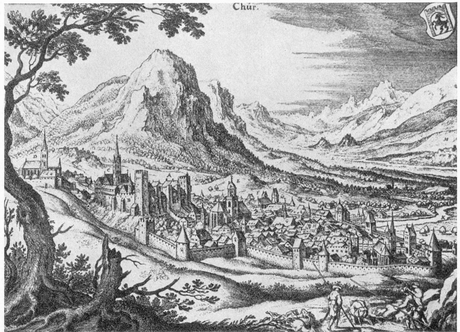
Alter Stich von Chur

Zunächst sah es zwar so aus, als ob Rätien vielleicht besser als jeder andere zeitgenössische Staat darauf gerüstet sei, den konfessionellen Hader zu dämpfen: da die Gerichtsgemeinden ohnedies schon über eine unübersehbare Fülle an Rechten geboten, lag es nahe, ihnen auch die Entscheidung über das religiöse Bekenntnis zu überlassen. Das ganze 16. Jahrhundert hindurch gelang es deshalb der alten und der neuen Lehre, verhältnismässig friedlich miteinander zu koexistieren. Nur der Zehngerichtenbund wandte sich so gut wie ganz der Reformation zu, obwohl auch hier einzelne katholische Inseln bestehen blieben; in den beiden andern Bünden standen alt- und neugläubige sowie ein paar paritätische Gemeinden nebeneinander,