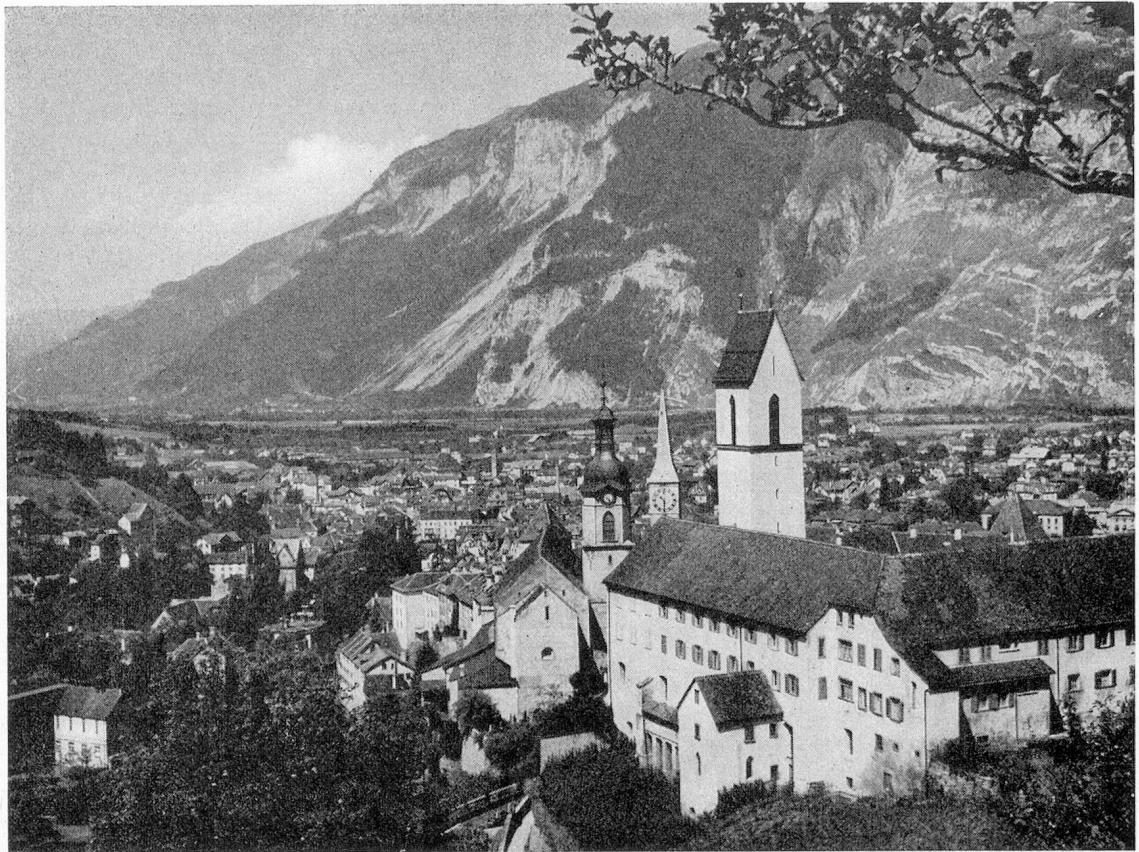
Chur im Frühling