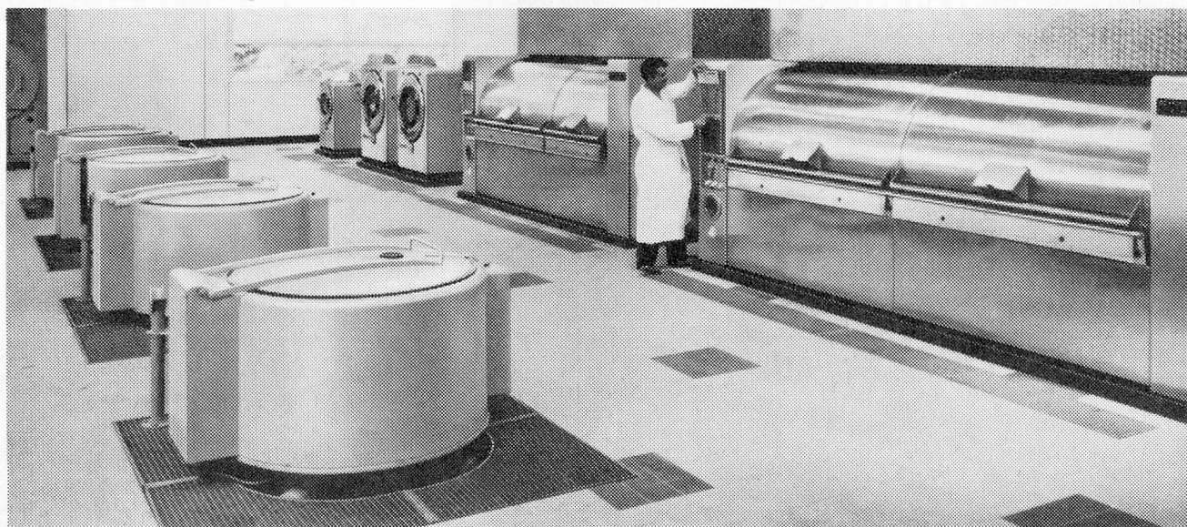
Grosswäscherei in Frankreich Tagesleistung ca. 3000 kg