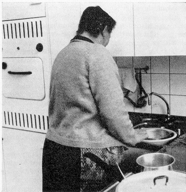
Überall in der praktisch eingerichteten Küche hat man Kästen eingebaut; links auf halber Höhe ist der Backofen.

wie das Küchen in Neubauten zu sein pflegen, wie es sich aber für 1-Zimmer-Wohnungen nicht von selbst versteht. Es gibt da einen Kühlschrank und einen Backofen, beide in Griffhöhe, so dass man sich nicht in die Hocke niederlassen muss, um etwas hervorzuholen; der elektrische Herd weist zwei Platten auf, und gleich anschliessend blitzt die Spülkombination. Und was die Benutzer der Küchen vor allem erfreut: neben, über und unter diesen Einrichtungen sind überall Schränke und Kästen eingebaut — eine Unmenge von Geschirr und Gerätschaften lässt sich darin verstauen. Ein breites Fenster schliesst die Küche gegen den Balkon ab, der viel grösser ist, als es von aussen den Anschein erweckt. Er ist beinahe sieben Quadratmeter gross und kann vom Wohnzimmer her betreten werden. Das Wohnzimmer erhält durch ein grosses Eckfenster viel Licht. Die Vorhänge an diesem Fenster sind übrigens überall dieselben, damit es von aussen einheitlich aussieht. Neben der Bettnische befindet sich nochmals ein Wandschrank, und über der Nische ist eine Vorhangstange in die Decke eingelassen, damit das Bett vom übrigen Raum getrennt werden kann. Telefon- und Rundfunk-Anschlüsse sind natürlich ebenfalls vorhanden.