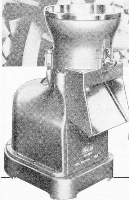
Gemüse- schneid- maschinen