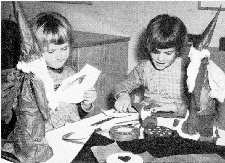
Im Jugendheim Bern vor dem Samichlaustag