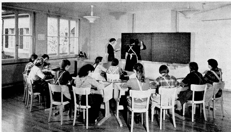
Blick in eines der freundlichen Schulzimmer

Was bleibt noch zu sagen? Der 5. Dezember 1957 bleibt als Festtag in der Erinnerung haften. Die Spitzen der Regierung und des kantonalen Parlamentes — ja, man staune, auch Bundesrat Dr. Markus Feldmann liess es sich nicht nehmen, in der frohgestimmten Gästeschar zu weilen — gaben ihrer Freude über das trefflich