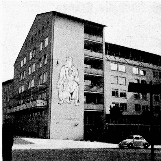
Eingang zum Ludwigstift

weide gab uns einen guten Begriff von der neuen, grosszügigen Bauetappe, die auf dem Familiensystem basiert.