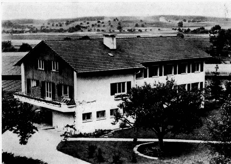
Lehrlingspavillon des Landheims Brüttisellen

Der Präsident des Mädchenheims Schloss Köniz BE weist darauf hin, dass scheinbar unwertes Leben nicht nur dadurch Sinn und Inhalt bekommt, dass es gelingt, eine geistesschwache Tochter soweit auszubilden, bis sie sich selber durchbringt, sondern vor allem auch dadurch, dass alle, die mit diesem Menschen umgehen, gebildet werden. «Nur dieses geistesschwache Mädchen kann in seinen Mitmenschen die tiefste Geduld zur Reife bringen, eine Geduld, die sonst gar nicht reifen würde.» Der Hausvater vergleicht seine Zöglinge von heute mit jenen vor 20 und 30 Jahren. Anstelle der Kinder vom Land sind vorwiegend solche aus der Stadt getreten. Sie unterscheiden sich nicht nur äusserlich, in Kleidung und Aussehen, voneinander, verwahrloste Stadtjugend ist auch innerlich ganz anders. Die Erziehungsaufgabe ist nicht kleiner geworden. Sie erfordert von allen Mitarbeitern besondere Qualitäten und grosse Hingabefähigkeit. Dafür wird ihnen auch herzlich gedankt.